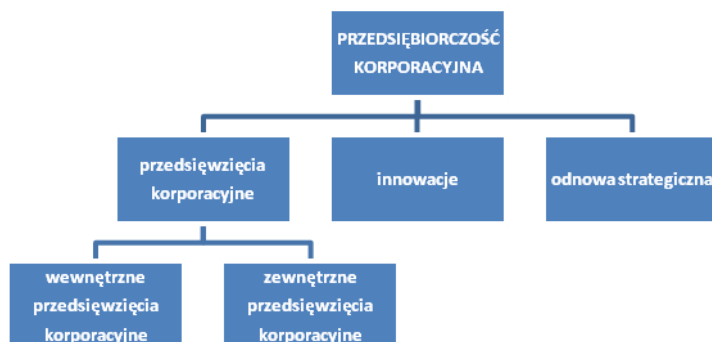
Rysunek 2. Przedsiębiorczość korporacyjna rodzaje